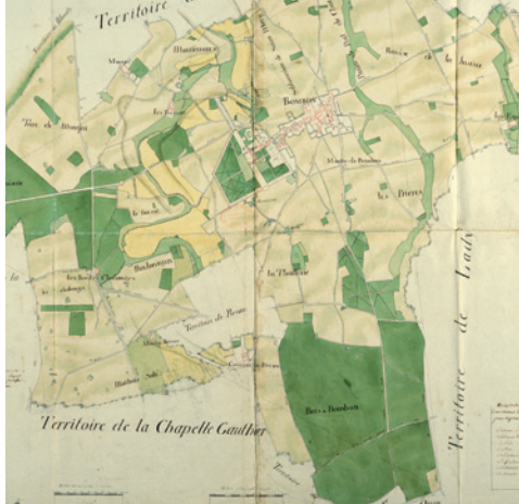
Plan d'intendance de Bombon (XVIII e siècle).

Le Département protège et valorise ces sites naturels afin que tous les Seine-et-Marnais puissent en profiter.