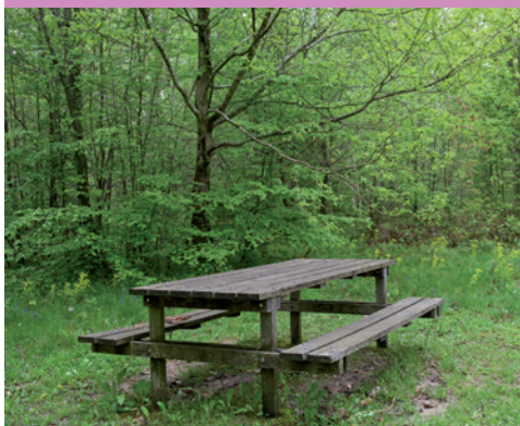
Zone d'accueil pour le pique-nique à l'entrée du site

L'ENS, d'une surface de 65 hectares, domine un méandre du ru d'Ancoeur, petit ruisseau qui a creusé son lit dans le plateau de la Brie. Le bois fait partie du massif forestier de Villefermoy d'un millier d'hectares.