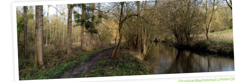
Site naturel départemental La Rivière (SEME)