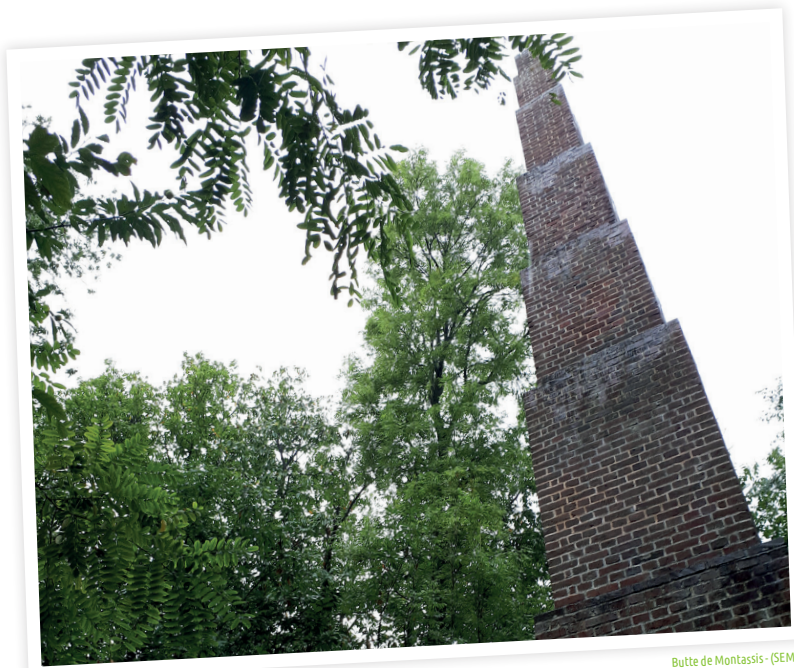
Butte de Montassis - (SEME)