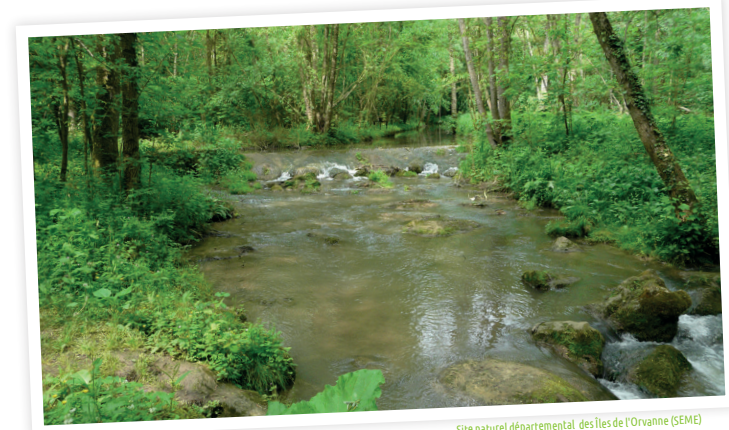
Site naturel départemental des Îles de l'Orvanne (SEME)