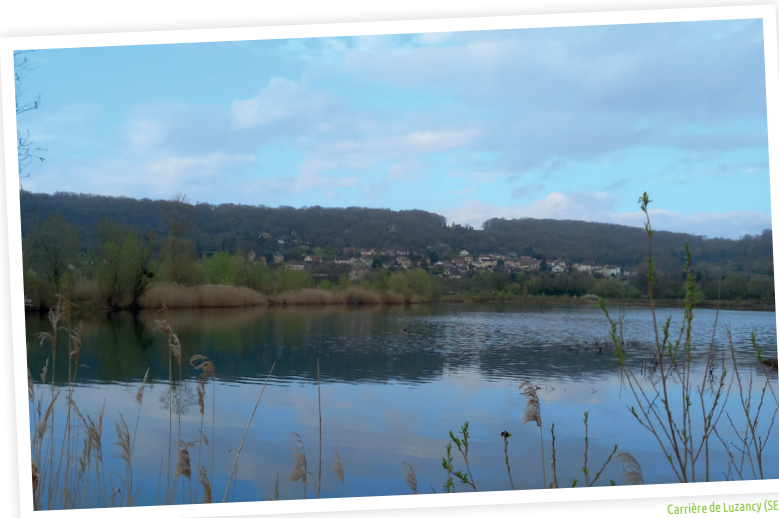
Carrière de Luzancy (SEME)